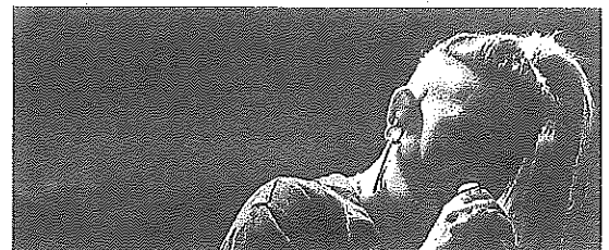
'La Furia', en concierto.