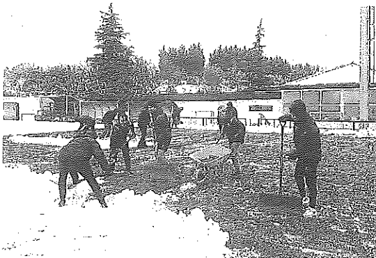
El cuerpo técnico colabora en la limpieza del césped de Ibaia.