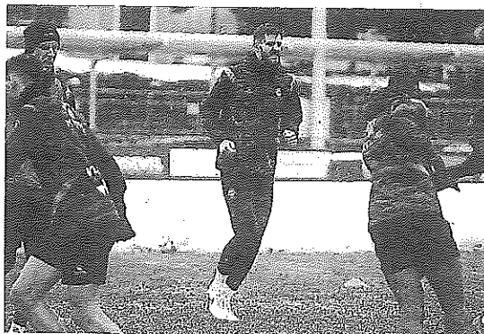
Al final fue posible entrenar.