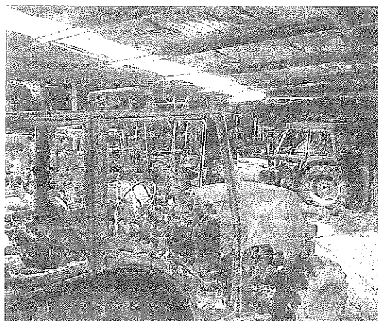
Ocho tractores calcinados en un incendio en un pabellón de Navaridas.