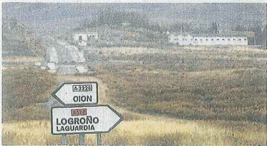
Carteles señalizadores en el límite provincial por carretera. JUSTO RODRIGUEZ

10 «El artículo 46 (...) constituye la aceptación (...) de una realidad gravosa para La Rioja derivada de la existencia (...) de subsistemas fiscales que conviven con el sistema fiscal nacional y que son constitucionalmente válidos. Con esta fórmula jurídica (...), el Estado asumió la obligación política de negociar bilateralmente para (...) compensar así los desequilibrios producidos en La Rioja (...). La materialización efectiva del derecho de compensación despliega un efecto disuasorio sobre comportamientos fiscales desleales futuros por lo que su previsión estatutaria resulta, además de un hecho diferencial para La Rioja, un elemento vertebral para la mejor defensa de sus intereses».