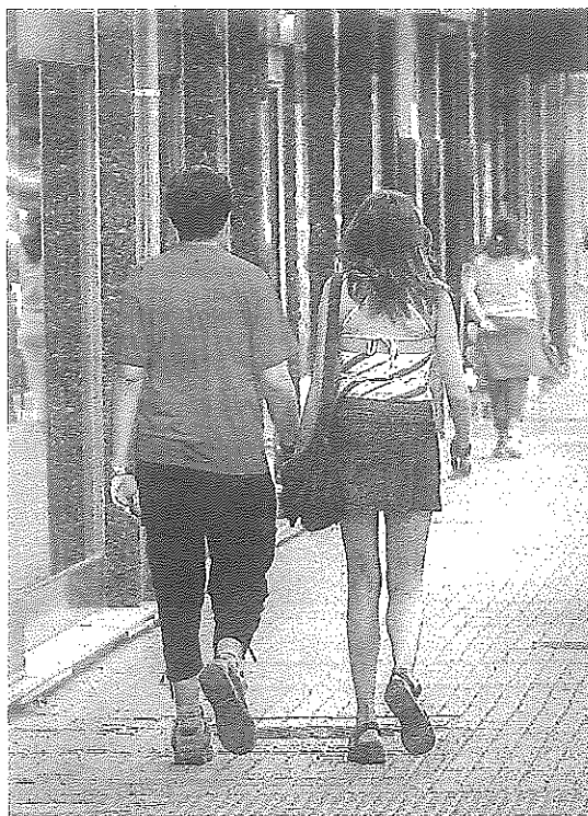
Una pareja pasea de la mano por la calle.