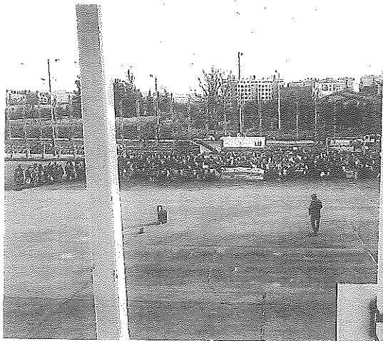
CONCENTRACIÓN. El patio de la ikastola Arantzabela fue el escenario donde ayer por la tarde se llevó a cabo una concentración de repulsa por las pintadas homófobas que aparecieron en la jornada del martes. El objeto de la agresión fue el moral a favor de la diversidad que desde hace unos meses tiene este centro educativo y donde se aboga por la pluralidad, el respeto y la diversidad hacia todas las tendencias sexuales.