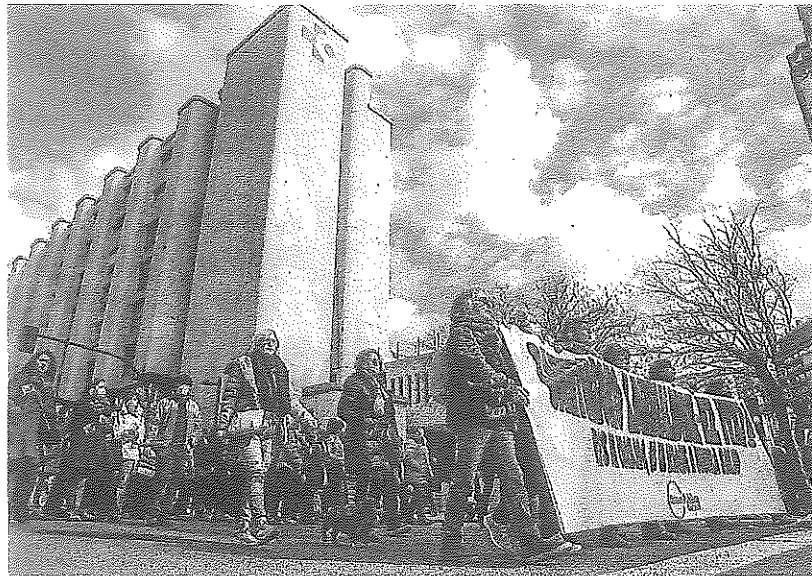
Cabeza de la marcha a su paso por el hospital Santiago. IGOR MARTÍN

Jon acudió a la protesta «por coherencia». Para este vitoriano, «están eliminando un servicio esencial del que se beneficiaba mucha gente que ahora tendrá que coger el tranvía, un coche, bus o el taxi cuando antes le bastaba con andar diez minutos. Yo a esto lo llamo precarización». Mientras hablaba, la marca humana coreaba con sincronía «Sagardui (consejera de Sanidad) es-