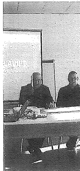
Presentación de Laudio Group.

SOLIDARIDAD CON GALICIA Por otro lado, el Ayuntamiento de Llodio ha querido mostrar su solidaridad y