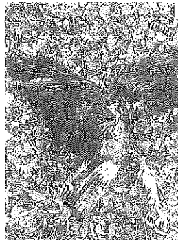
Restos del ave fallecida.

Realizado un seguimiento del recién llegado se pudo comprobar