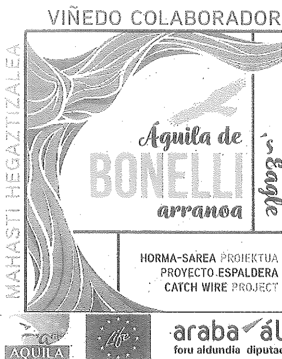
El sello de Viñedo colaborador con el Proyecto Espaldera.

Debido a su rigidez y su escaso grosor, estos alambres son poco detectables para las águilas, así como para otras aves. La abundancia de presas existentes en muchos viñedos atrae a menudo a cazar a águilas y demás