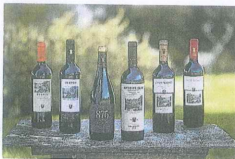
Los tintos de El Coto, acierto seguro.

El Coto se ha puesto al día sin perder su propia identidad. Durante estos más de 50 años de trayectoria, el mayor premio para la bodega ha sido la confianza de las personas amantes del vino, que han convertido a El Coto de Rioja en la bodega líder del mercado español en todas las categorías en las que elabora: Crianza, Reservas, Blancos y Rosados. Supone todo un reto mantener esa posición y seguir siendo un referente del vino en todo el mundo al exportar sus botellas a más de 70 países.