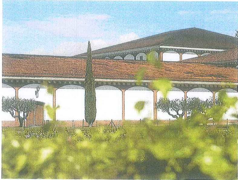
Todos los vinos tintos de El Coto se envejecen en al menos durante 12 meses tras estos muros.

Sin embargo, en ese proceso existe un condicionante previo tan sustancial como la crianza, el método o el roble francés que acuna los caldos. Se trata del viñedo. Ese es el origen de la calidad de los vinos. Consciente de ello, la bodega invierte parte de los beneficios anuales en incre-