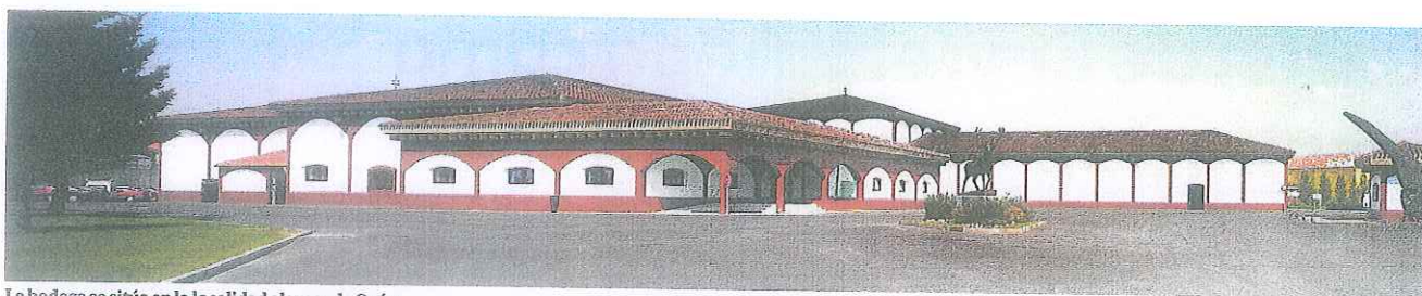
La bodega se sitúa en la localidad alavesa de Oyón.

mentar su superficie de viñedo propio. Así es como se ha convertido en el mayor viticultor de la DO Rioja, capaz de ofrecer a su equipo enológico enormes posibilidades para la elaboración de vinos singulares al contar con pagos en todas las subzonas de Rioja (Alta, Alavesa, Oriental), en las que se cultivan diferentes variedades y con composiciones de suelo, altura y orientación radicalmente distintos.