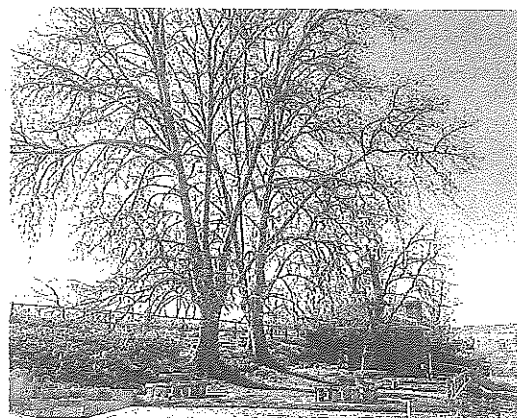
La fuente Ompedera de Villamediana de Iregua.

En 2020 el Ayuntamiento de Villamediana reparó el pilón y embelleció los muretes de piedra de Ompedera, recuperando esta zona de recreo en un entorno natural y sustituyendo las mesas y bancos.