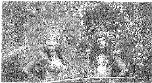
Imagen promocional de la fiesta 'Esto es Brasil', v.l.

M. H. Villa-Lucía retoma sus fiestas 'ComeCultura'. Mañana, el espacio de Laguardia trae de nuevo el carnaval, con su fiesta 'Esto es Brasil', donde habrá baile, música y mucho más.