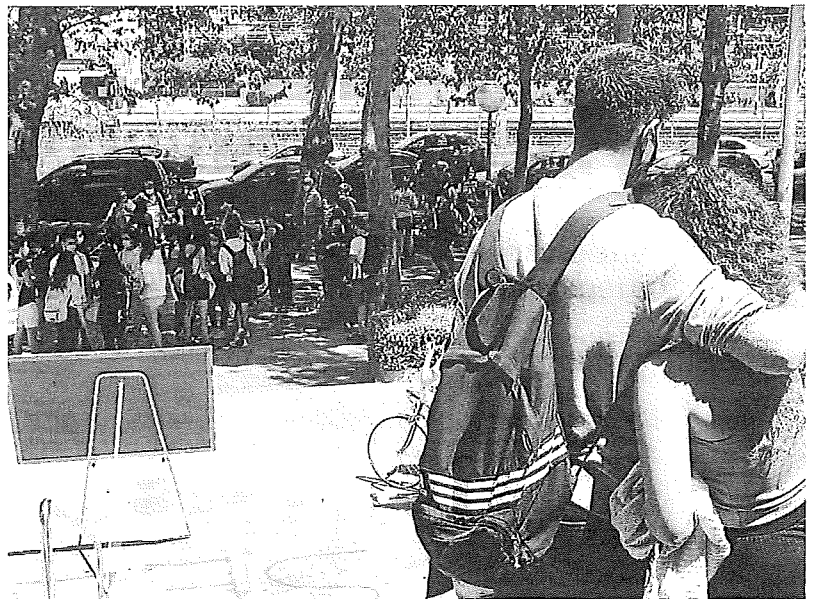
Pareja de jóvenes, ajenos a esta información, abrazándose.

Por municipios, los que tienen más personas en paro son, como es de esperar, los que tienen más habitantes. Este caso es el de Vitoria (15.045); Llodio (1.133); Amurrio (760); Aguirain (342) y Oion (259). Tras ellos, están Alegria-Dulantzi (187), Iruña Oka (182) y Legutio (103). ●