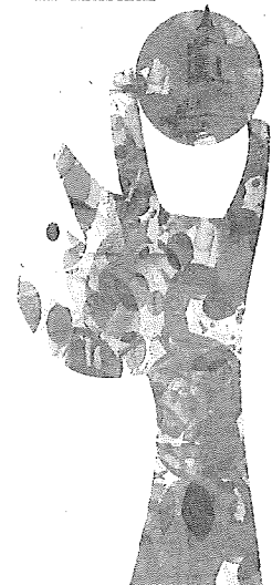
Cartel anunciador 'Protagonista'. A. L.

intensos colores es la necesidad «de marcar el color de la vida ante los días oscuros que hemos pasado en los dos últimos años». Reconoce que el golpe visual de