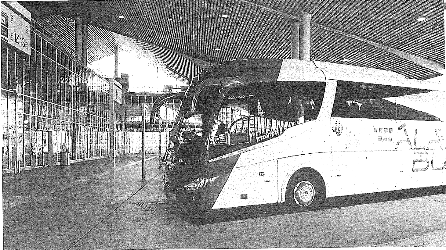
Autobús aparcado en una dársena de la estación de autobuses.