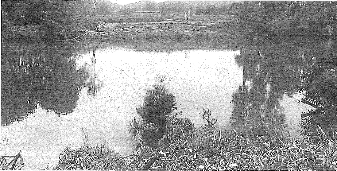
Orilla del río Ebro a su paso por Baños con los árboles talados.