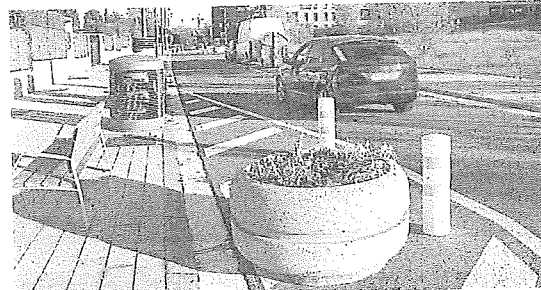
Se han pintado varias 'chicane' junto con pivotes y jardineras.

de varias 'chicane' en las líneas de aparcamiento que fuerzan a los vehículos a realizar un giro y aminorar la marcha. En estos elementos se han colocado jardineras y pivotes. En la misma travesía, ubicada en Aretxabaleta, se ha incorporado un Stop en el cruce con la calle San Millán, mientras la rotonda con Iruraiz-Gauna ha pasado de dos carriles a uno.