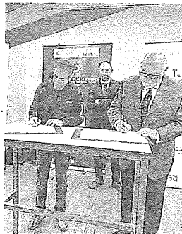
Ayer se firmó el convenio. EL CORREO

El modelo de regulación de los recursos hídricos que se va a poner en marcha permitirá un ahorro de agua del 20% respecto al consumo actual dado que «la nueva balsa captará las aguas sobrantes de la época invernal y permitirá un ahorro energético porque el riego se hará por gravedad, sin bombeo», señalaron desde el Mi-