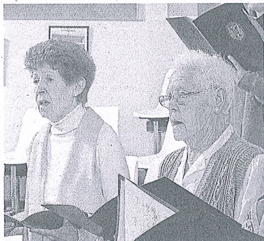
Fotograma de 'Cuerdas' el corto de Urresola.