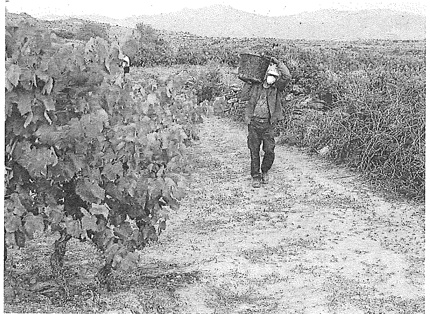
Vendimia en Rioja Alavesa.