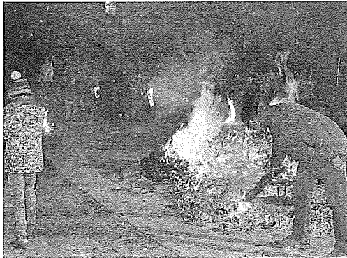
La quema de las mañas en una edición anterior.

Con los albores de la Navidad, el día 23 se ha previsto un concierto pintxo pote de villancicos, organizado por Prudentzio Eguntentia y en la tarde de Nochebuena se celebrará una concentración en la ikastola, a la que es obligatorio acudir vestidos de caseros para participar acompañando al Olentzero hasta la plaza Mayor. - P.J.P.