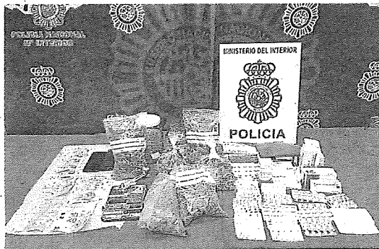
El alijo hallado en el vehículo del hombre detenido. L.R.

Los agentes observaron que el conductor, al detectar la presencia de los uniformados, realizó un comportamiento atípico, llevando a cabo una repentina maniobra huidiza. Por este motivo, los policías identificaron al conductor e inspeccionaron el vehículo por si se estaba cometiendo alguna ilegalidad. El hom-