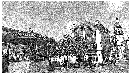
Plaza Mayor de Oyón. M. H.

El domingo, la fiesta continuará con la danza de los santos patronos, las degustaciones y la actuación del grupo musical 'Kittu' en una jornada en la que habrá fuegos artificiales. Para finalizar, el lunes se darán los últimos coletazos con actividades de entretenimiento para los más pequeños y un nuevo pase del toro de fuego.