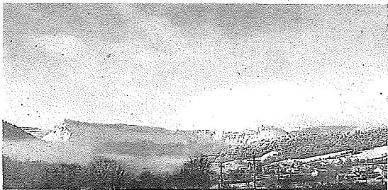
Retirada de nieve en Valuerca, en Valdegovía, Salinillas de Buradón, panorámica de Sierra Salvada y puerto de Herrera. En el recuadro, Murgia.