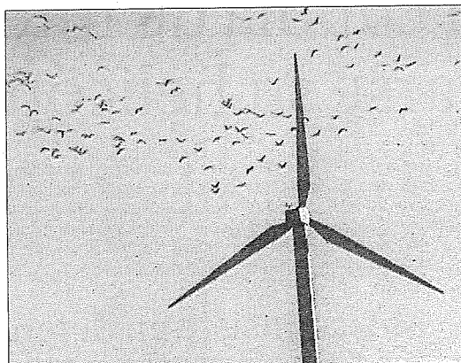
Detalle de un molino eólico.

Y, «siendo un tema que está generando un gran debate social», reclamó que el PTS sea elaborado con una amplia participación social y priorizando criterios que busquen los beneficios para las personas y el medio ambiente.