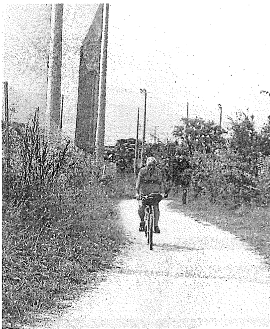
Ciclista andando por una senda del Anillo Verde.

Tecnológico de Miñano donde trabajan más de 3.500 personas. Estamos ultimando el proyecto para licitarlo, acometer las obras este año 2023 y ponerla en servicio en 2024".