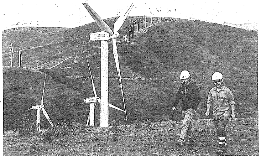
El parque de Elgea es uno de los dos que está en funcionamiento en Álava. JESÚS ANDRADE