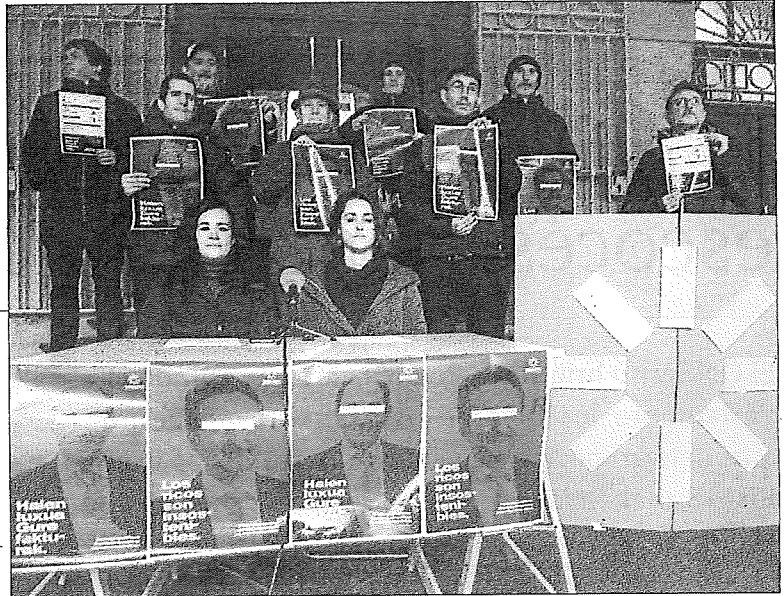
Jauzi Soziala kanpainaren aurkezpena, atzo, Donostian.

Igual que Aixendiar hoy, la empresa pionera en la energía eólica en la CAV se formó en 1995 con la participación del EVE e Iberdrola, en aquel caso al 50% de participación. Cada una puso 20 millones de pesetas para formalizar la sociedad que construyó los cuatro parques eólicos que hasta el boom de nuestros días han operado en la CAV, con una modesta potencia instalada de 143 megavatios –la eólica no llegó a suponer el 2% de la electricidad generada en la CAV durante los primeros tres trimestres de 2022–. En 2007, sin embargo, Lakua decidió vender su mitad a Iberdrola, que desde entonces controla en su totalidad los cuatro parques de la CAV, que siguen rindiendo beneficios.