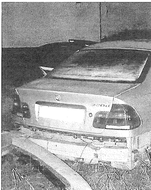
Estado en el que quedó el coche implicado.

●●● Treviño. El Pleno del Ayuntamiento de Treviño ha aprobado una moción a favor de las comunidades energéticas. En la moción, la corporación municipal se ha comprometido a llevar a cabo una transición energética y, en este sentido, reconoce el potencial de las comunidades energéticas para avanzar en esa transición. Así, el Ayuntamiento se ha comprometido a promocionar y apoyar las comunidades energéticas en el término municipal. —P.J.P.