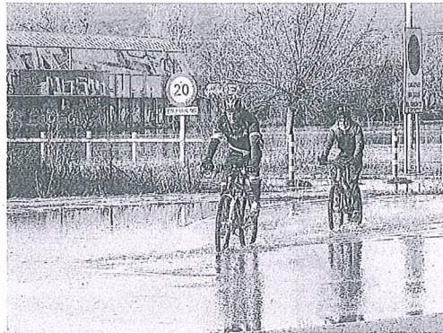
Dos personas se desplazan en bicicleta.

La celebración del foro desarrollado ayer en el Europa, que organiza Basquetour, es según Hurtado "un ejemplo de la apuesta de Euskadi por este sector". — C.M.O.