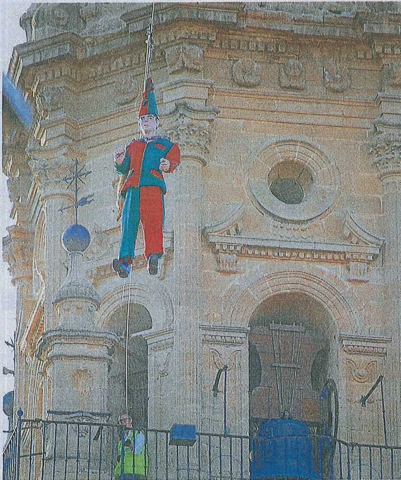
Descenso del Katxi en Oion.