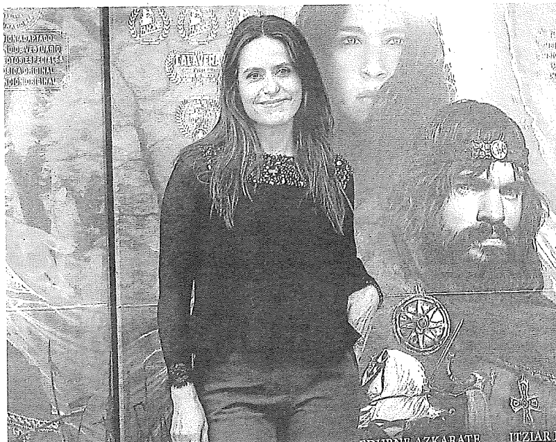
Itziar Ituño, en la presentación de la película 'Irati', ayer en Madrid.

La actriz de 'Irati' recuerda que los Premios Feroz, que concede la Asociación de Informadores de Cine, tuvo «un tono muy reivindicativo» en las voces de muchas mujeres. «Me parece un insulto que ocurriese esto porque la gala había sido rompedora. Y de pronto, esto después de todo