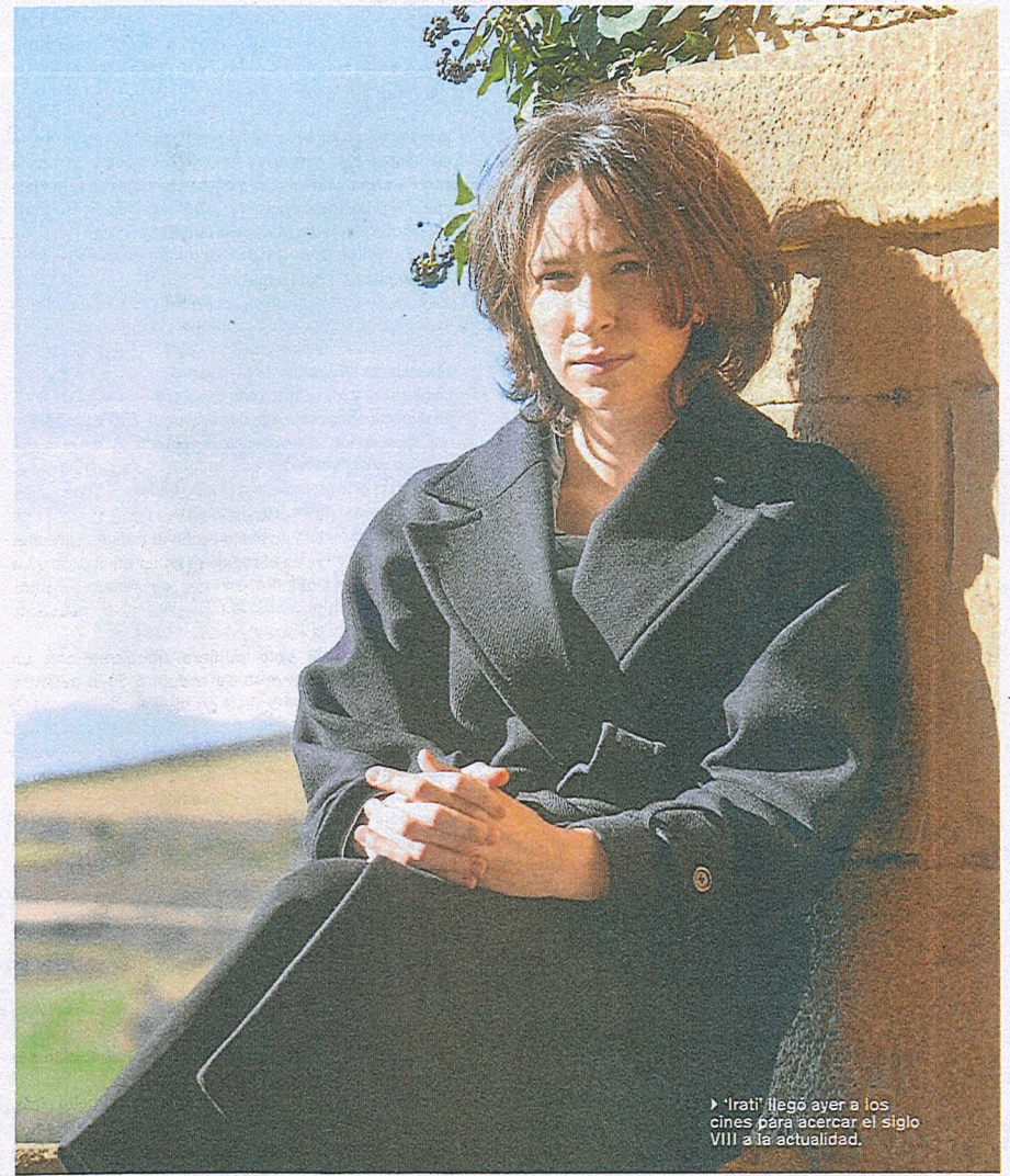
► ‘Irati’ llegó ayer a los cines para acercar el siglo VIII a la actualidad.

Me gustaría que la gente salga satisfecha de haber recibido un relato histórico, épico y fantástico, que coman muchas palomitas durante la proyección y que si se sumergen en esto que queremos contar me encantaría que salieran conmovidos por la propia historia o lo que le pasa a los personajes, y a través de eso que se conmuevan por lo que cuenta la película,