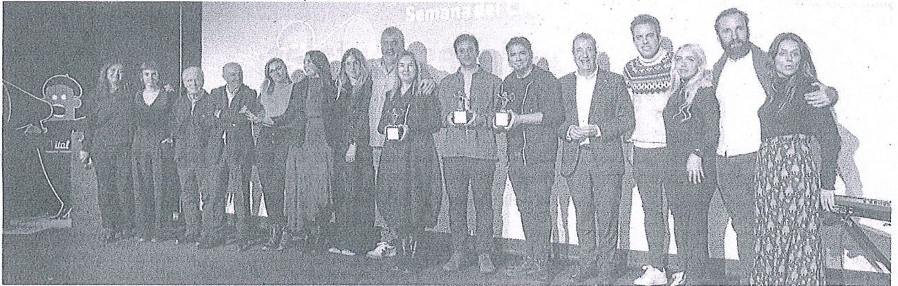
Los equipos de 'Irati' y 'Tula', las cintas vencedoras del certamen posan tras la gala de clausura.