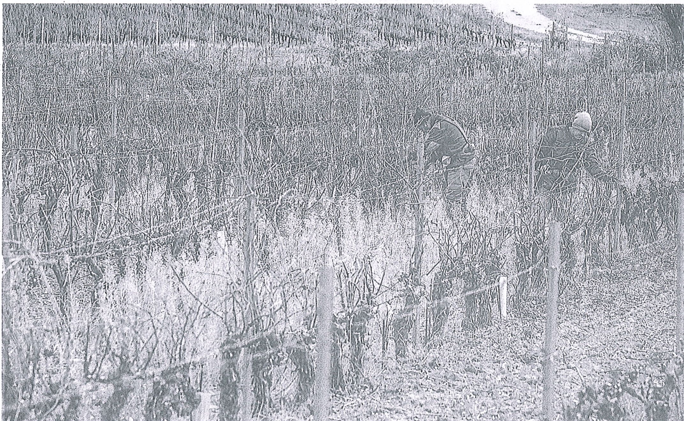
Dos agricultores trabajan en su viñedo en Rioja Alavesa. RAFA GUITÉRREZ