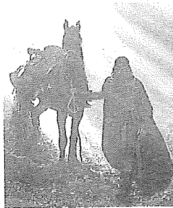
Escena de 'Irati'. e. c.

La distribuidora catalana Filmax ya apostó fuerte con un elevado número de copias en versión original para que esta fantasía épica basada en la mitología vasca se viera en euskera en plazas como Málaga, Oviedo, León, Salamanca, Valladolid, Barcelona, Madrid, Valencia, Lugo, Las Palmas y Logroño, en-