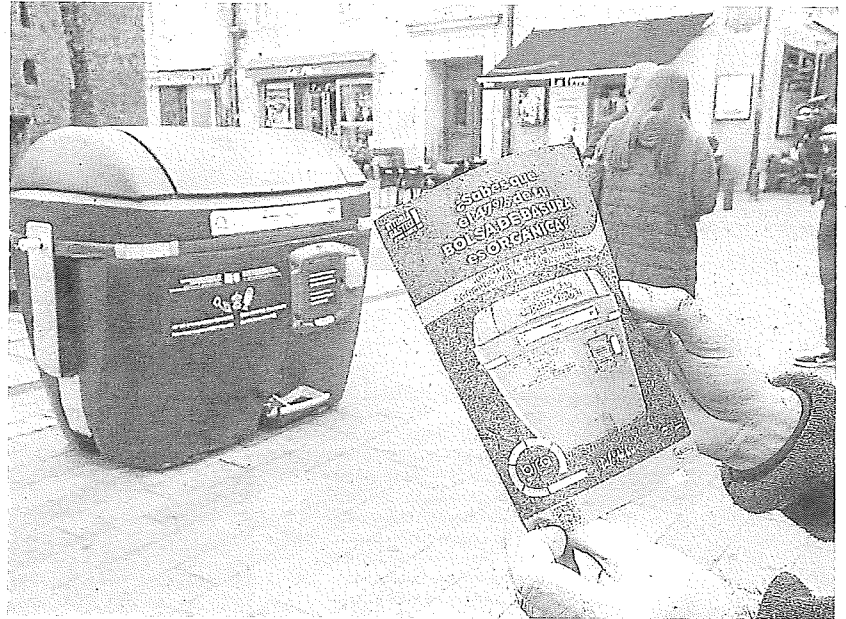
El aumento de contenedores de fracción orgánica en Vitoria ha mejorado los datos del territorio.