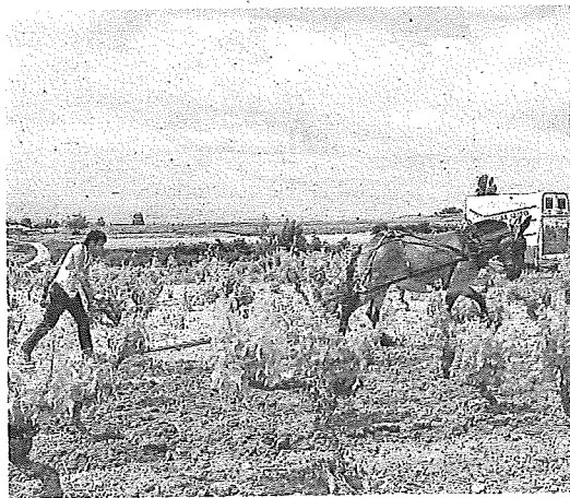
Labranza en un viñedo viejo.

Acto seguido y hasta las 10.30 horas, se dará paso a la presentación de varias experiencias en el ámbito de la Optimización y Digitalización de Pro-