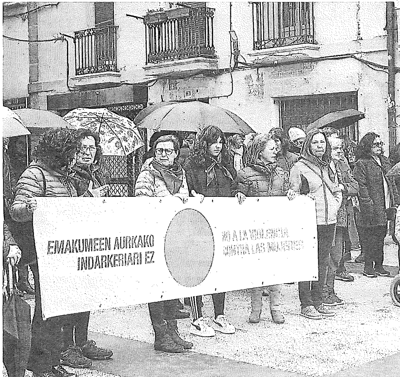
La concentración celebrada en Araia.

GORBEIALDEA En la comarca de Gorbeialdea las actividades se centraron especialmente en Zigoitia, aunque en otros pueblos también se desarrollaron más actividades. En Zuia la jornada giró en torno al lema Denon bizitzak erdigunean (Todas las vidas en el centro). Y con esa idea, a las doce del mediodía se puso en escena el espectáculo Zaintzak en el Gaztetxe, para las chicas del Instituto, de la mano de Barrabaskeri. A las cinco de la tarde se organizó la decoración de coches en Ostuño y desde allí y desde la plaza de Zuia se fue en caravana a la manifestación de