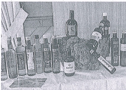
Un momento del acto de ayer y distintos aceites de Rioja Alavesa.

conocer este aceite e informar a quienes nos visitan de las diferentes actividades que se pueden realizar en torno al mundo de este aceite de la variedad Arroniz": "También queremos reconocer a todas las generaciones de alavesas y alaveses que con su esfuerzo, compromiso y dedicación han ayudado y ayudan a la supervivencia del olivo en tierra de vides, de los que han llegado hasta