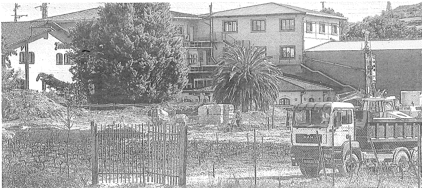
Espacio en el que se acometerá la nueva construcción que completará el proyecto del estudio de arquitectos londinense. IGOR MARTÍN