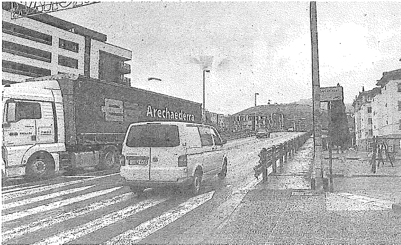
El puente de la autovía de Llodio es uno de los puntos más ruidosos de la red de carreteras alavesa. s. ESPINOSA