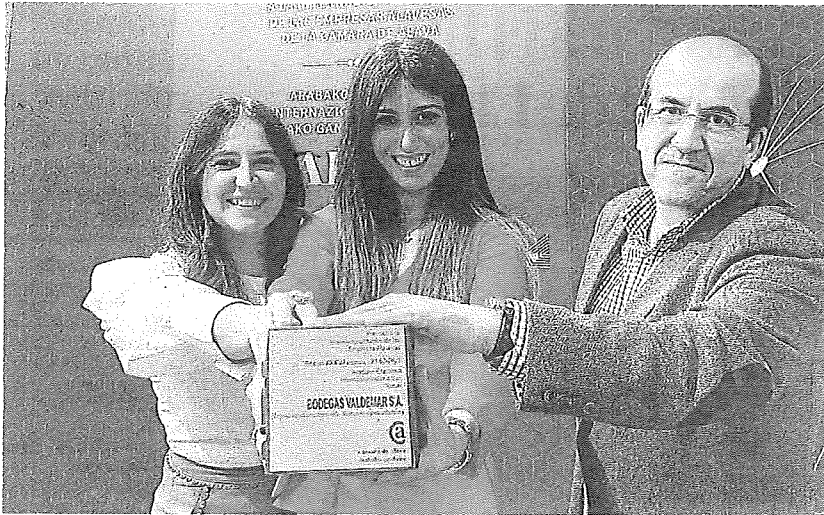
La entrega del premio.