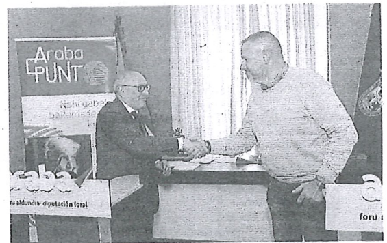
Firma del acuerdo de adhesión de municipios alaveses, ayer.

Asimismo, los ayuntamientos de Armión, Ayala, Campezo, Iruraz