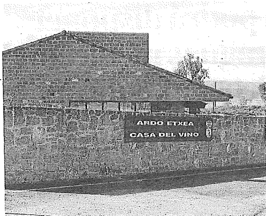
Imagen de la Casa del Vino de Laguardia.