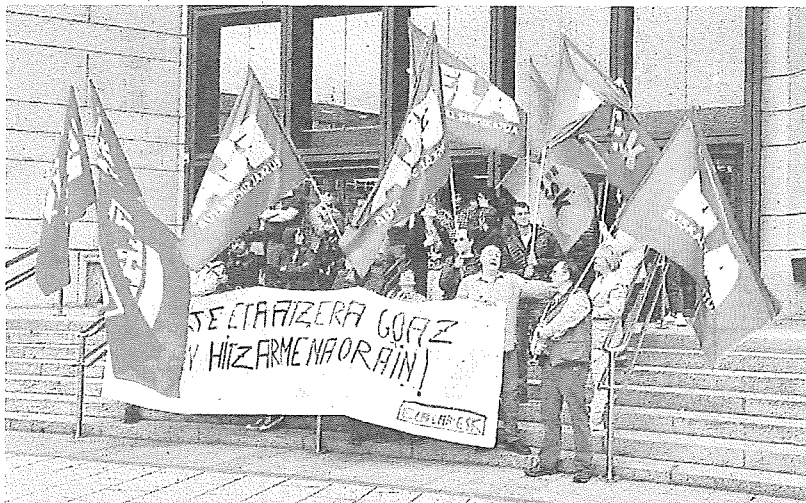
EITBko Irratielako zentro arteko batzordeak deituta, elkarretaratzea egin zuten atzo Bilboko egoitza aurrean. ELA

Lau eskaera egin dituzte langileen ordezkariak: «Lan hitzar-