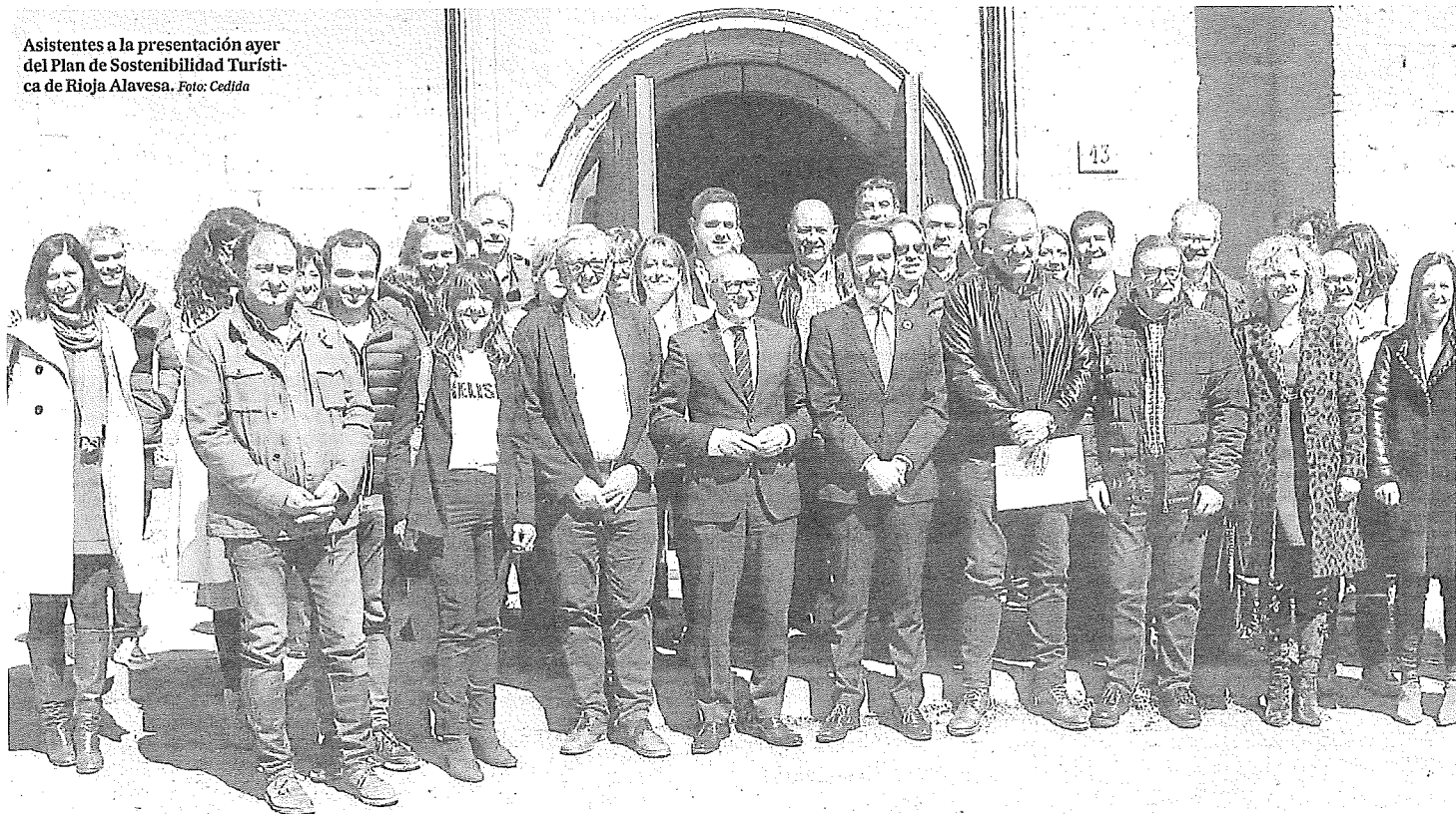
Asistentes a la presentación ayer del Plan de Sostenibilidad Turística de Rioja Alavesa.

La Ruta del Vino de Rioja Alavesa ha desarrollado el plan y la Cuadrilla se ha encargado de las presentaciones a ambas convocatorias. Así desde noviembre de 2021 hasta mayo del 2022, que fue cuando se presentó el proyecto definitivo, ambas entidades han trabajado juntas, apoya-