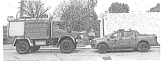
Los nuevos vehículos adquiridos.

Un objetivo de la institución ha sido el posicionar en cada una de las bases una autobomba forestal, así como disponer de dos más adicionales para ampliar las operaciones con personal adicional en incendios de importancia, así como suplir en el supuesto de avería, cualquiera de las existentes en los parques, asegurando así durante la campaña forestal, que estos recursos estén disponibles