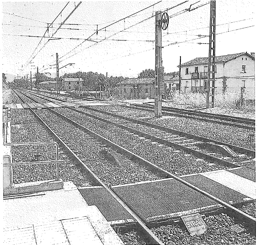
Paso a nivel en la localidad de Manzanos.

Se proyecta el trazado en planta y alzado del tronco de la variante de la carretera A-4342 para una velocidad de proyecto de 60 km/h, cumpliendo con los requisitos mínimos establecidos en la normativa vigente. Con ellos, se busca mejorar las condiciones de seguridad vial en la zona. En términos generales las obras recogidas en este proyecto se pueden dividir en las siguientes cinco partes: nuevo trazado de la Carretera Foral A-4342, vial de conexión de Manzanos, paso inferior 2+100, obras de drenaje transversal y depósito de sobrantes.