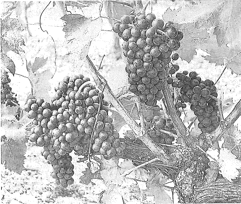
Uvas en un viñedo de Rioja Alavesa.