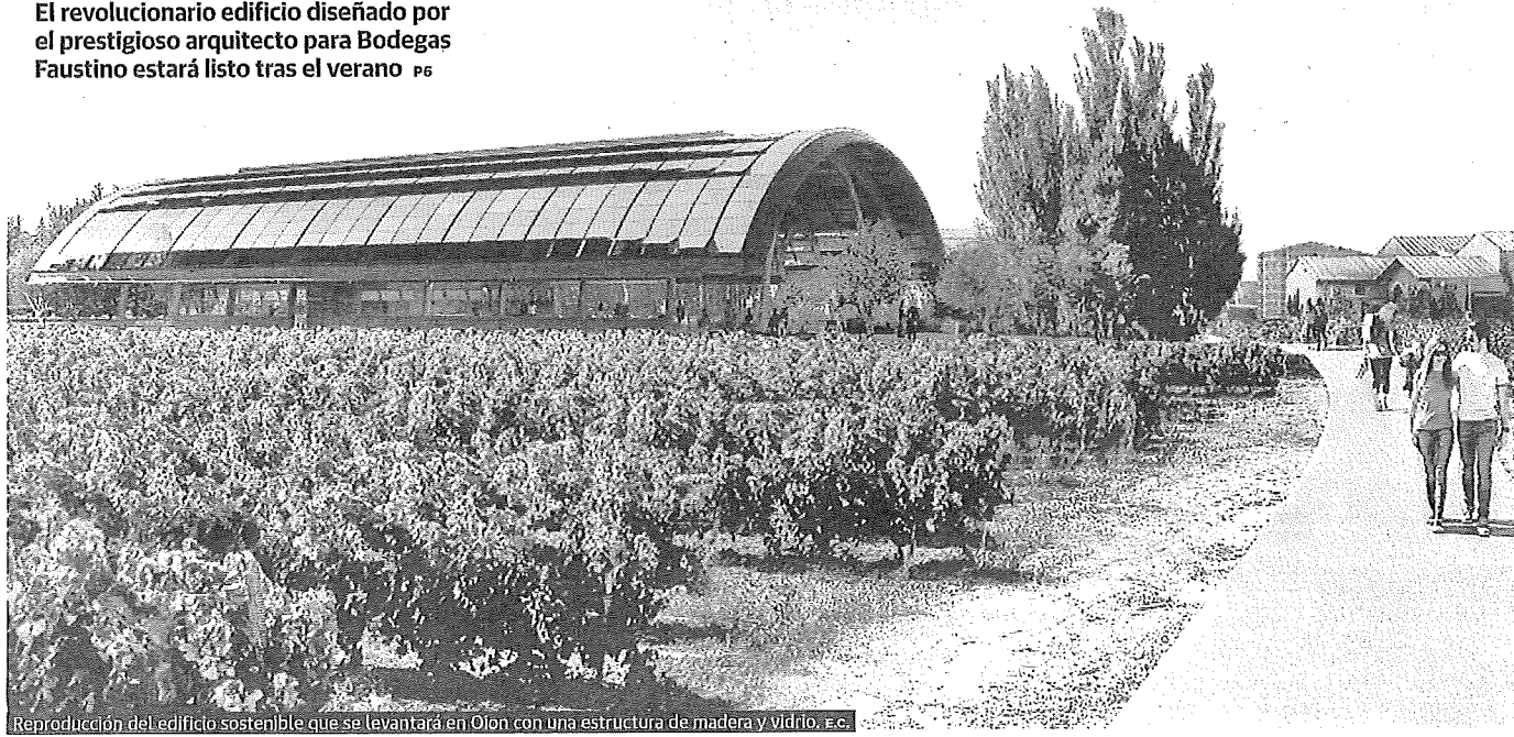
Reproducción del edificio sostenible que se levantarán en Oion con una estructura de madera y vidrio, etc.

El revolucionario edificio diseñado por el prestigioso arquitecto para Bodegas Faustino estará listo tras el verano P6